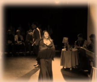
Padres de Picasso