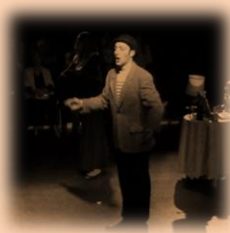
Los padres de Picasso