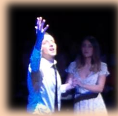
Picasso y Dora Maar