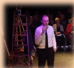
Pintando el Guernica