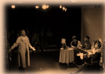
El pintor Casagemas