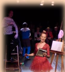
Arlequín Periodo Rosa